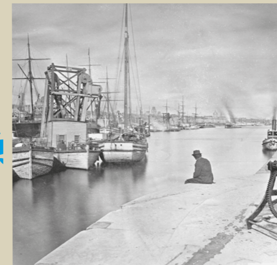
Vue du port depuis les écluses, vers 1875. Wm. Notman, Musée McCord d'histoire canadienne (VIEW-958.0) / Harbour view, from canal locks, about 1875. Wm. Notman, McCord Museum of Canadian History (VIEW-958.0)

Here at the downstream entrance to the canal, you once would have found yourself on the border between two worlds. On one side was the maritime domain, turned mainly towards Europe, an inexhaustible source of manufactured goods and new immigrants. On the other side was the river domain, focused on the transport and export of the abundant raw materials that made the country's fortune. Despite appearances, the lock operators had no respite: their incessant labour ensured that commerce ran smoothly.