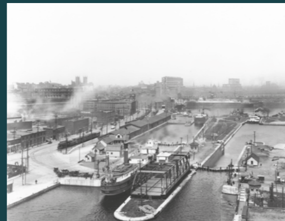
L'entrée du canal dans le port de Montréal, vers 1925. Musée des sciences et de la technologie du Canada (CN 000364) / Entrance to the canal in Montreal harbour, circa 1925. Canadian Science and Technology Museum (CN 000364)