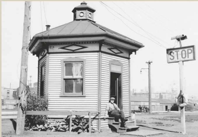
Éclusier dans sa logette, écluse n° 2, 1923. / Lock keeper in his cabin, Lock No. 2, 1923.