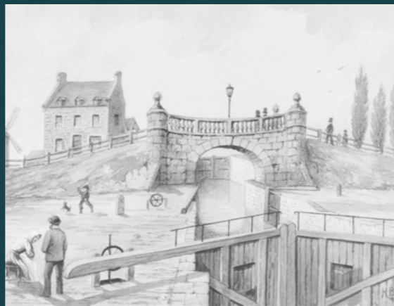
L'écluse n° 2, vers 1825. H. Bunnett, vers 1881, Archives nationales du Canada (C-113716) / Lock No. 2, circa 1825. H. Bunnett, circa 1881, National Archives of Canada (C-113716)

The canal opened in 1825, enabling vessels to bypass the Lachine Rapids. Today, its imposing locks are used only by small pleasure craft. The scene was very different during the last century, when the canal could barely accommodate the large river freighters. Precursor of the St. Lawrence Seaway and cradle of Canadian Industry, the Lachine Canal has left its mark on a city where it continues to play a role in the modern era.