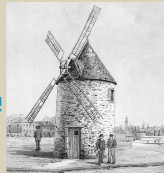
Le vieux moulin à l'entrée du canal de Lachine. H. Bunnett, vers 1881, Archives nationales du Canada (C-113718) / Old Windmill at the Entrance to the Lachine Canal. H. Bunnett, circa 1881, National Archives of Canada (C-113718)