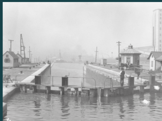
L'écluse n° 2, 1908. Lock No. 2, 1908.

The canal built in 1825 met the river on the west side of the old city. Its downstream entrance comprised a series of three small locks, which were replaced in 1848 by two larger locks separated by a wider basin, Basin No. 1. In 1885, two more locks were added. The entrance to the canal now comprised four locks, Nos.1 and 2 North, and Nos. 1 and 2 South, and two basins, No. 1 North and No. 1 South. The complexity of the site and the volume of traffic kept increasing: it was not unusual to see all four locks occupied at the same time.