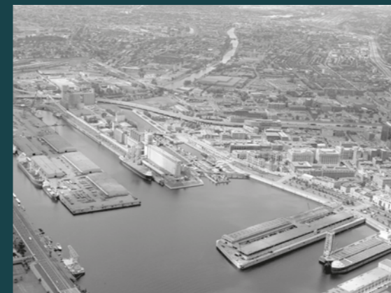
L'entrée du canal dans le Vieux-Port de Montréal, 2000. / Entrance to the canal in the Old Port of Montreal, 2000.