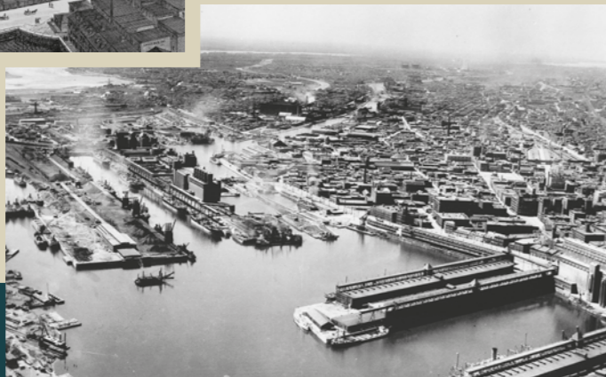
L'entrée du canal dans le Vieux-Port de Montréal, 1930. / Entrance to the canal in the Old Port of Montreal, 1930.