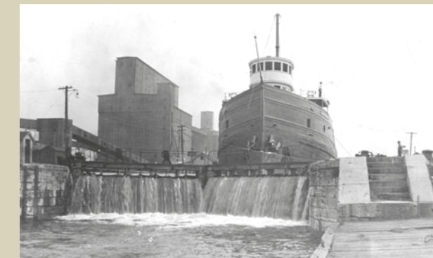
Bateau dans l'écluse n° 1 du canal de Lachine / A ship in Lock N° 1 of the Lachine Canal

L'inauguration du canal de Lachine en 1825 ouvre la route des Grands Lacs aux navires. La circulation maritime augmente dans le port, et des manufactures s'installent le long du canal, créant le premier centre industriel du pays. L'arrivée de la Voie maritime en 1959 amène la fermeture du canal en 1970. Il est réouvert en 2002 pour la navigation de plaisance.