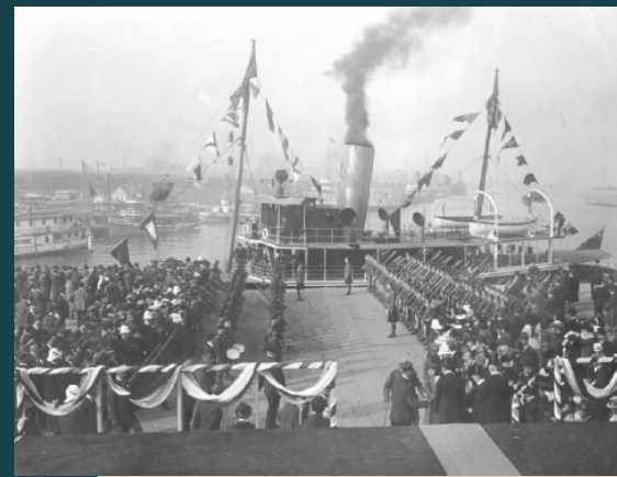
Inauguration du quai Victoria par Son Altesse Royale, Duc de Connaught et de Strathearn, gouverneur général du Canada, le 27 septembre 1916. / Inauguration of Victoria Pier by H.R.H. the Duke of Connaught and Strathearn, Governor-General of Canada, September 27th, 1916

Plus d'un siècle plus tard, le Vieux-Port reste un lieu de célébrations et de festivités. Chaque année, près de 6 millions de personnes viennent profiter d'une promenade riveraine de 5,5 km sur un site chargé d'histoire. C'est l'été que le Vieux-Port devient le plus audacieux et festif : le site offre aux publics une foule d'activités interactives, culturelles et de détente, qui le rendent encore et toujours vibrant.