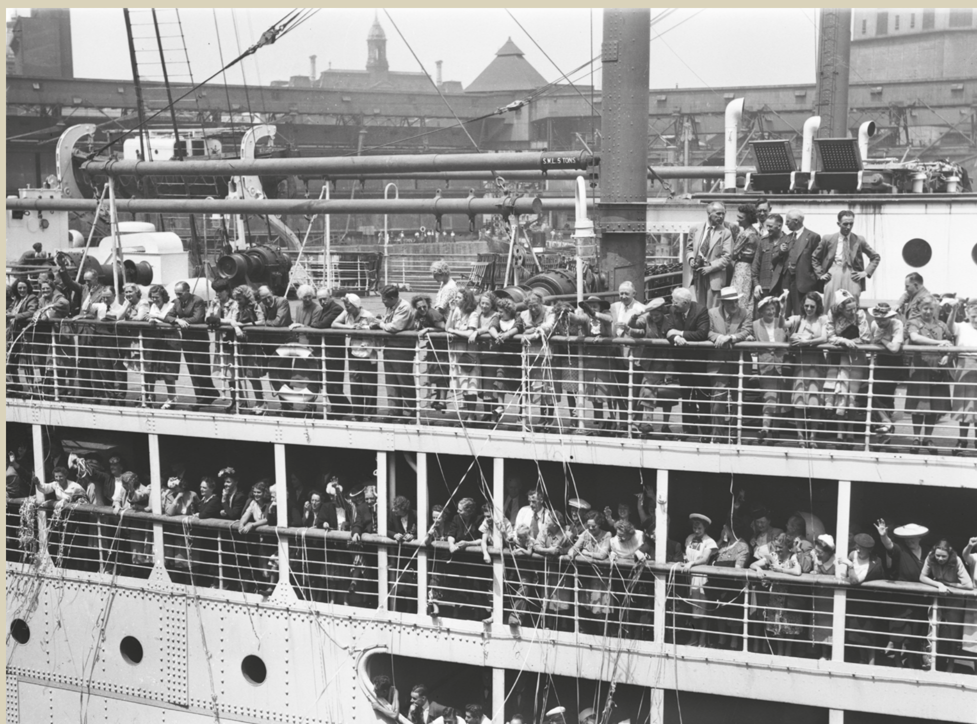
Ship Empress of Canada, 26 juillet 1947 / July 26, 1947

- Rachel Billette. À l'âge de 20 ans, en 1963, elle est partie pour un voyage de deux mois en Europe avec trois de ses amies de Saint-Louis-de-Gonzague.