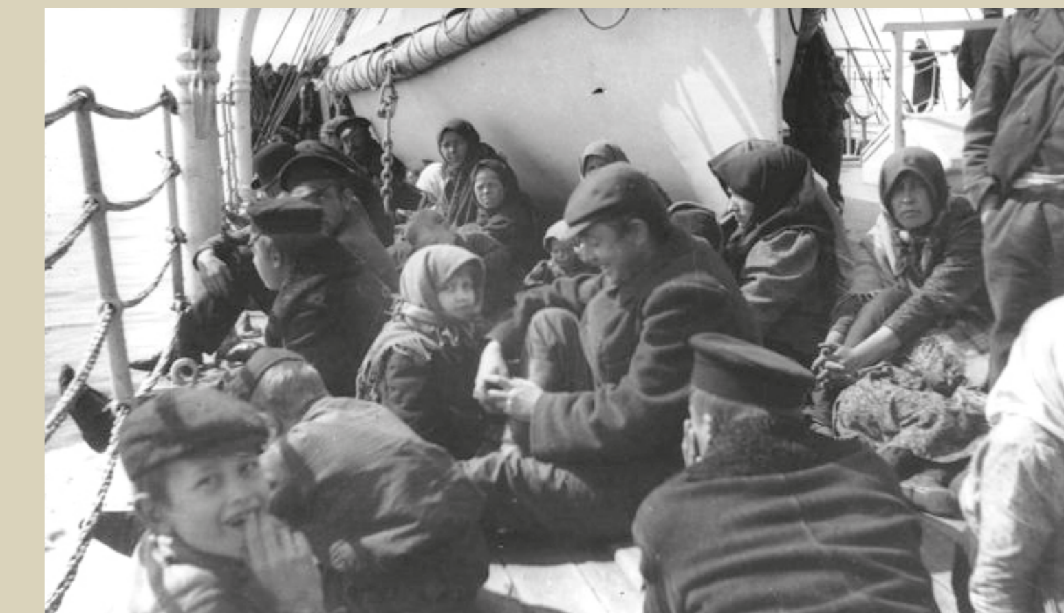
Groupe de réfugiés ou d'immigrants sur un bateau / Group of refugees or immigrants on a ship, Siège social de la Edmonstone, Allan and Company, 19 e siècle / Head office of Edmonstone, Allan and Company, 19 th century

Par train ou par bateau, les immigrants affluent vers Montréal. La vague d'immigration des années 1840 comprend des dizaines de milliers d'Irlandais fuyant la famine, en plus d'Anglais et d'Écossais. Entassées dans les cales de cargos, ces populations effectuent la traversée de 12 jours dans des conditions souvent insalubres. Durant la deuxième vague, de 1896 à 1914, le Canada accueille trois millions d'immigrants d'Europe de l'Est, d'Italie et d'Allemagne.